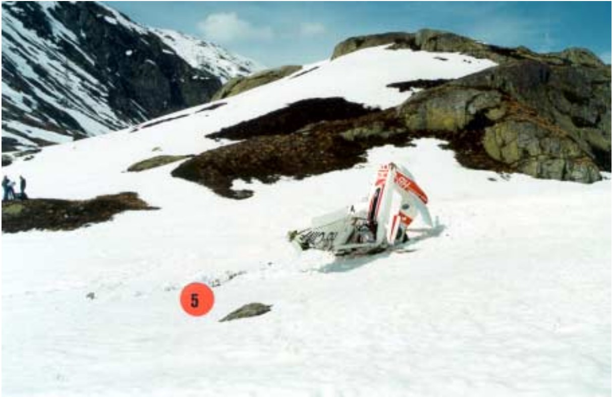
5) Spur des linken Flügels auf dem Schnee