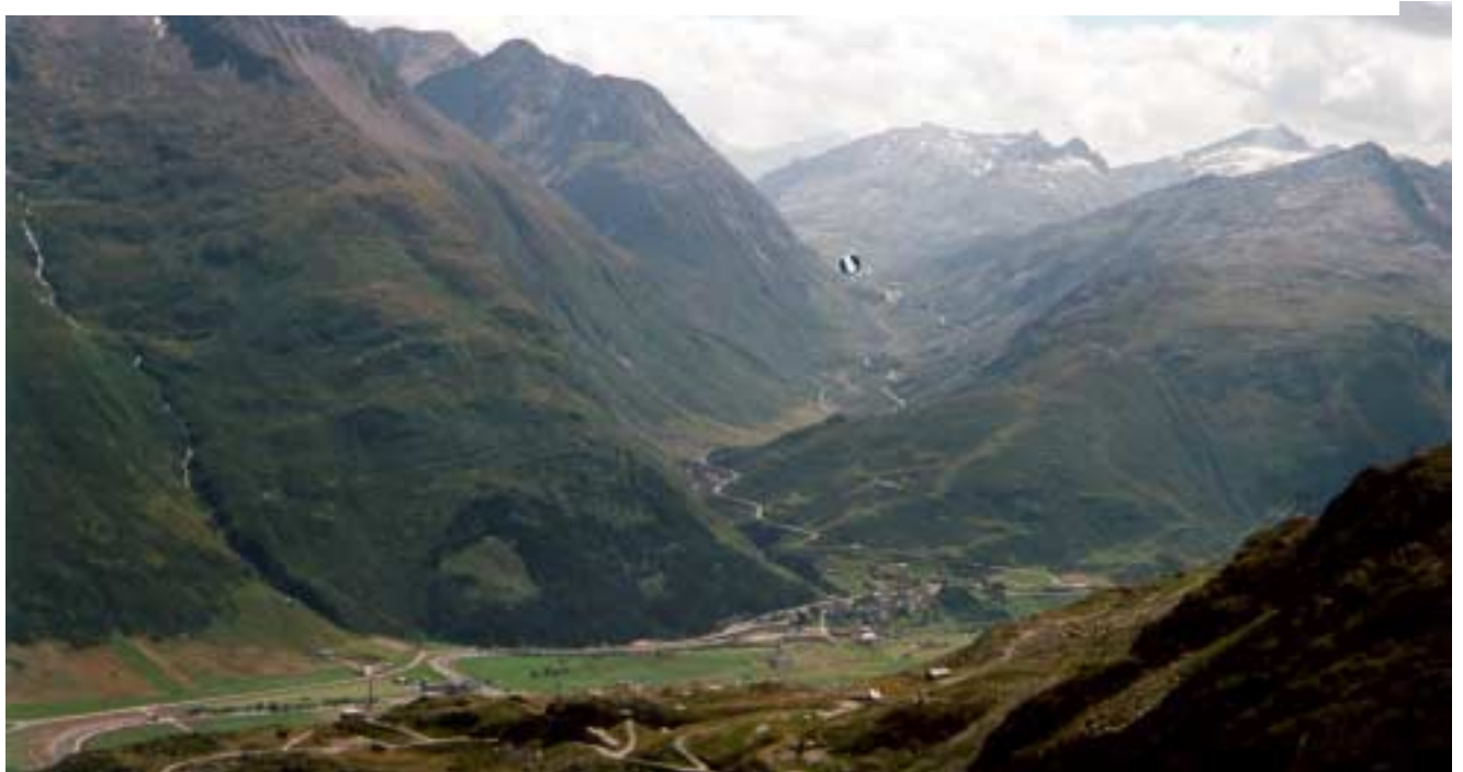
Sicht gegen Süden (Gotthardpass) aus 2'200 m/M, über Andermatt